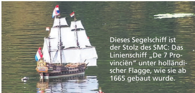
Dieses Segelschiff ist der Stolz des SMC: Das Linienschiff „De 7 Provinciën“ unter holländischer Flagge, wie sie ab 1665 gebaut wurde.